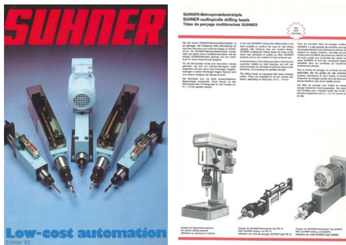
Fig. 1+2: Catálogo SUHNER de 1982 y una página del mismo

En 1982 SUHNER presentó orgullosa en su catálogo sus nuevos cabezales múltiples, que aunaban una gran capacidad de taladrado con mínimas dimensiones y con un diseño moderno“.