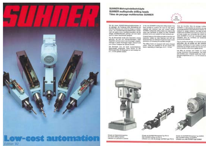
Fig. 1+2: SUHNER - Catalogo 1982 - copertina e pagina

Nel catalogo dell'anno 1982, la società SUHNER ha orgogliosamente presentato le sue nuove teste di foratura multiple „con le quali si è riusciti a combinare le richieste dell'alta resa della foratura ad una dimensione ridotta insieme al design moderno“.